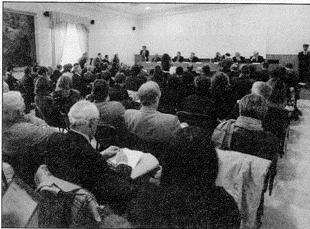
Un momento dell'incontro

Cinque i temi sul tavolo: la competitività della filiera, la